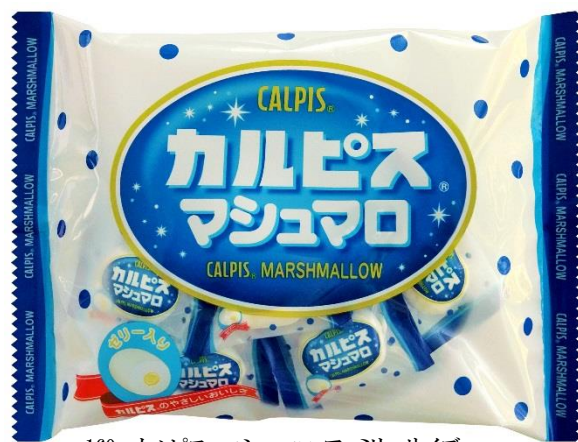
160g カルピス®マシュマロ・ファミリーサイズ