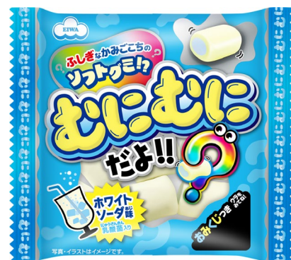
17g むにむにだよミニパック(ホワイトソーダ味)