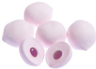
※グレープマシュマロ