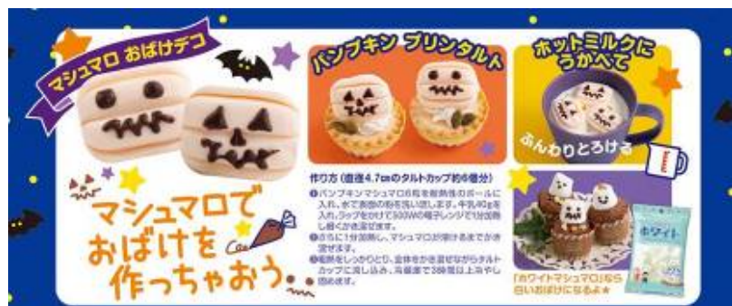
※パッケージ裏面のアレンジレシピ