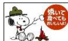
※裏面イラスト抜粋

PEANUTS ® © Peanuts Worldwide LLC www.snoopy.co.jp