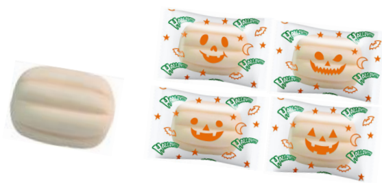
※パンプキンマシュマロ