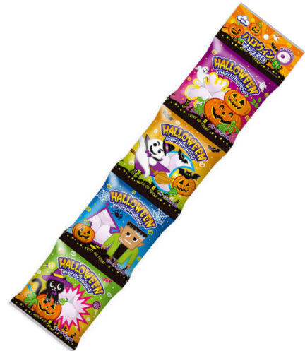
4連ハロウィングレープマシュマロ