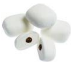
※チョコマシュマロ