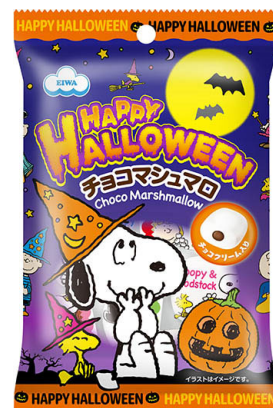
38g スヌーピー・チョコマシュマロ