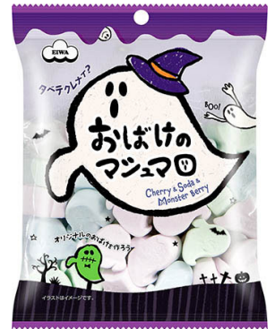
60g おばけのマシュマロ