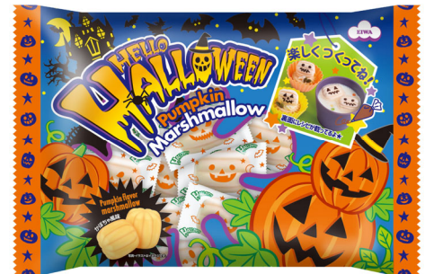
130g ハロウィンパンプキンマシュマロ(大袋)